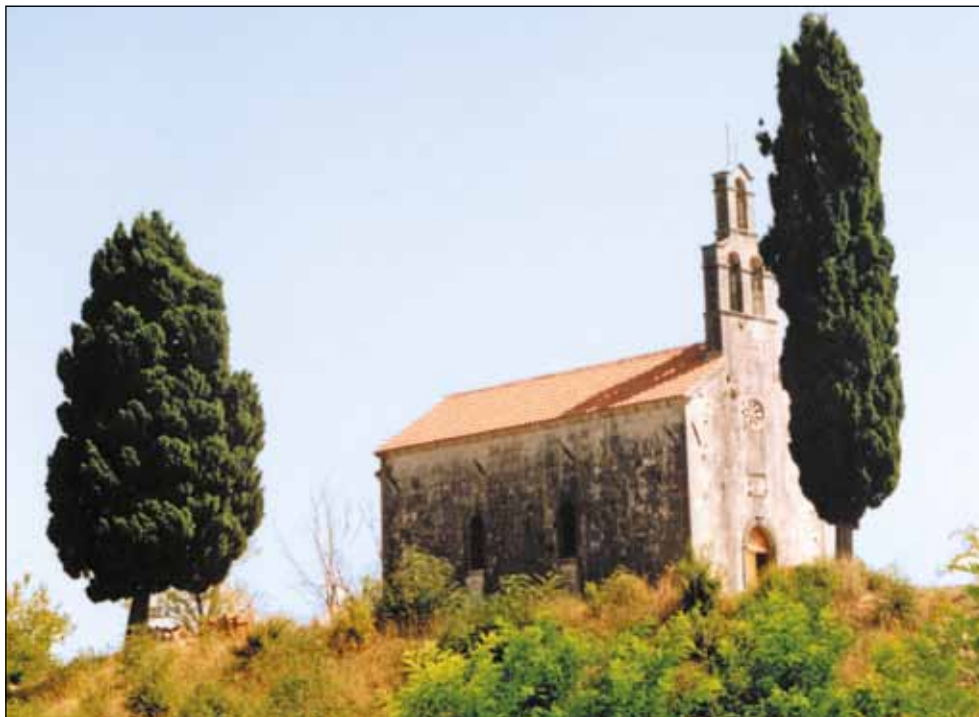
Манастир Врађина, црква Светог Николе, 13. век - Зетска Света Гора -