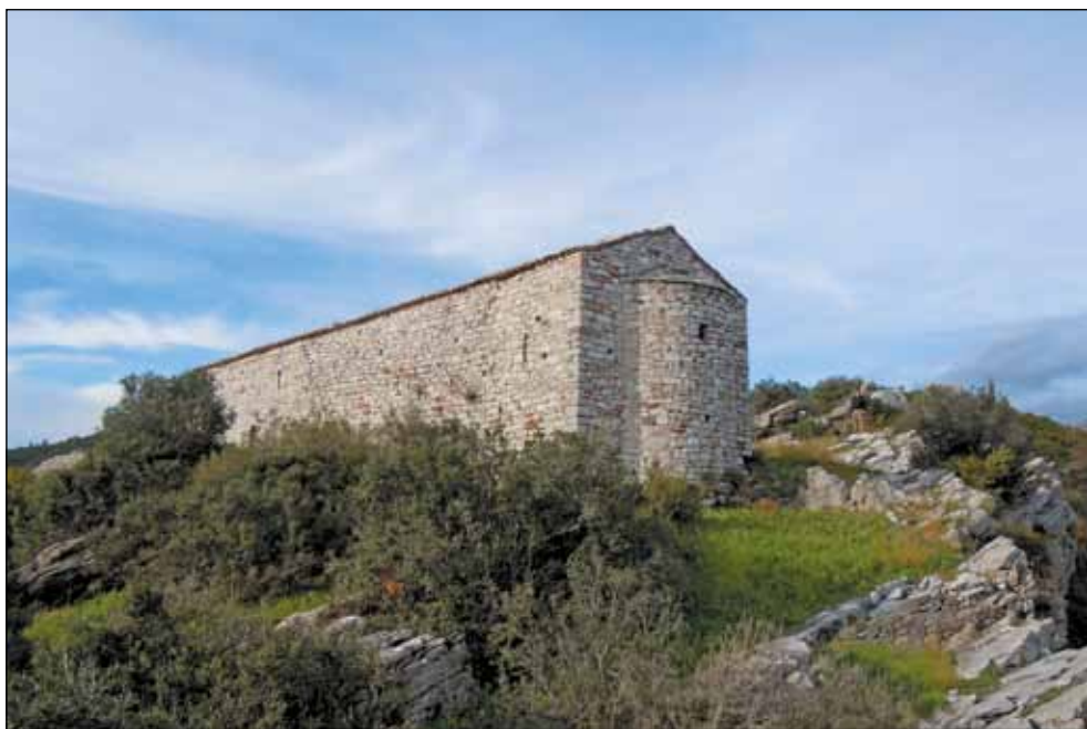
Црква Светог Николе, 14. век - средњовековни град Сарда -