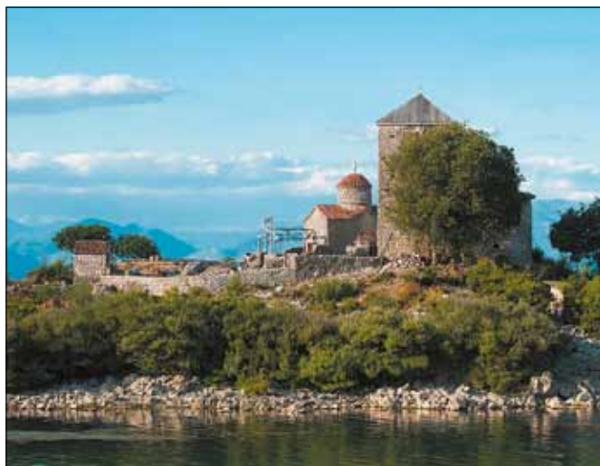
Манастир Морачник, црква Пресвете Богородице, 15. век - Зетска Света Гора -