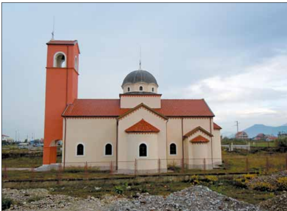
Црква Свете Тројице, Врака - Скадар - подигнута 1993. године -