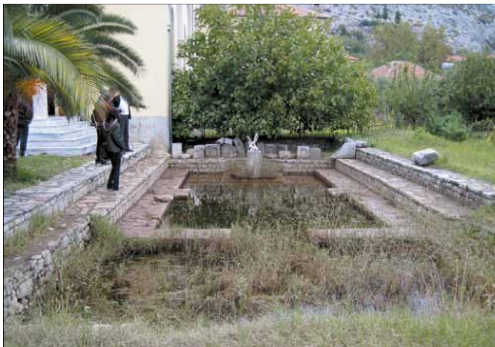
Црква Пресвете Богородице, крај 13. века, - остаци темеља - цркву подигла Јелена Анжујска - Дањ - Вау Дејсе, срушена у „културној револуцији” 1968. године