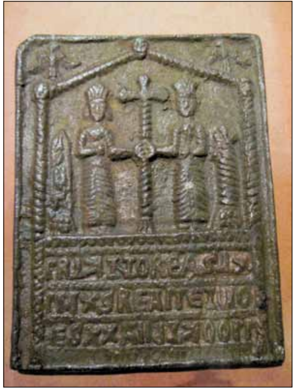
Оков повеље византијског цара Алексија III Анђела којом је манастир Хиландар додељен Стефану Немањи - 12. век - Збирка музеја у Скадру