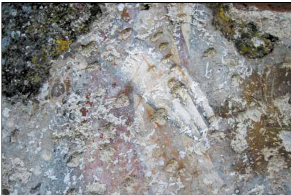
Део фреске светих ратника на јужном зиду цркве Св. Срђа и Вакха, 13. век, село Ширћ - Скадар