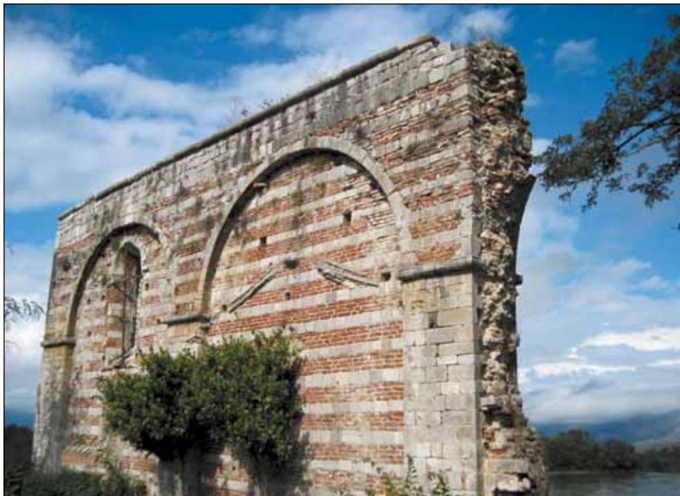
Црква Св. Срђа и Вакха, село Ширћ - Скадар (на обали реке Бојане) - цркву подигла Јелена Анжујска (жена Краља Уроша I) 1290. године - цркву обновио њен син Милутин 1311. године - остаци јужног зида -