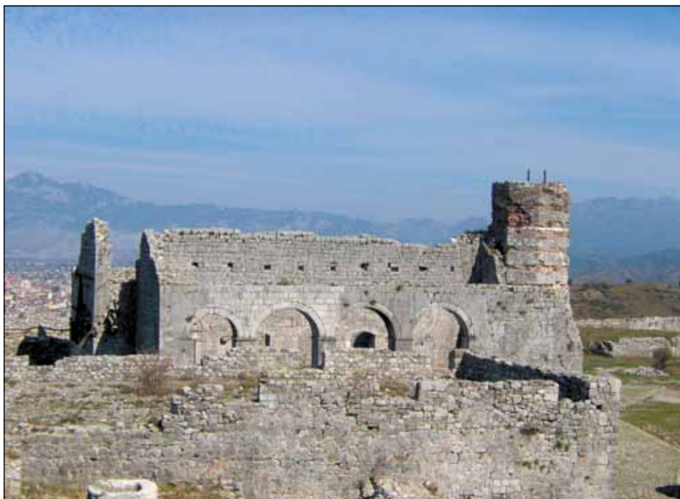
Црква Св. Стефана, подигнута почетком 14. века - налази се у централном делу Скадарске тврђаве -