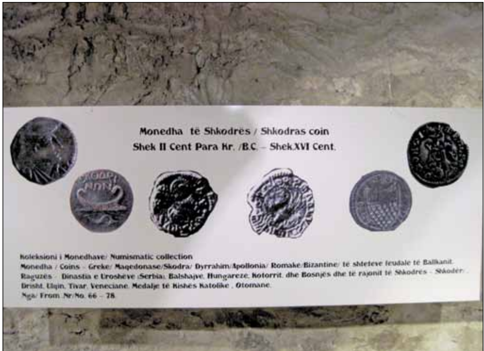
Део збирке старог новца који се користио на простору Скадра од 2. - 16. века - збирка музеја у Скадру -