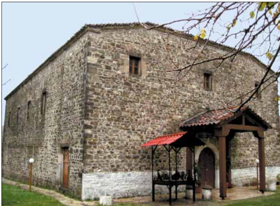
Црква Св. Јована Владимира у Елбасану, 11. век - у цркви су се од 11.-21. века налазиле мошти Св. Јована Владимира -