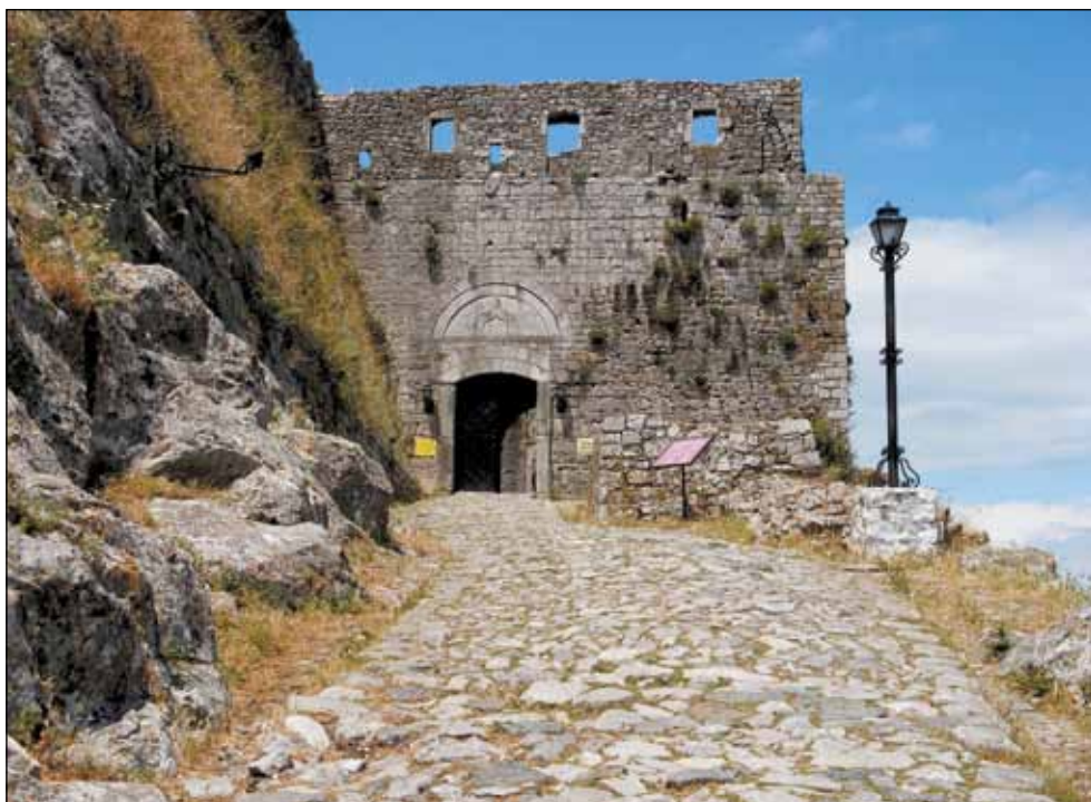
Улаз у Скадарску тврђаву - подигнута у 13. веку -