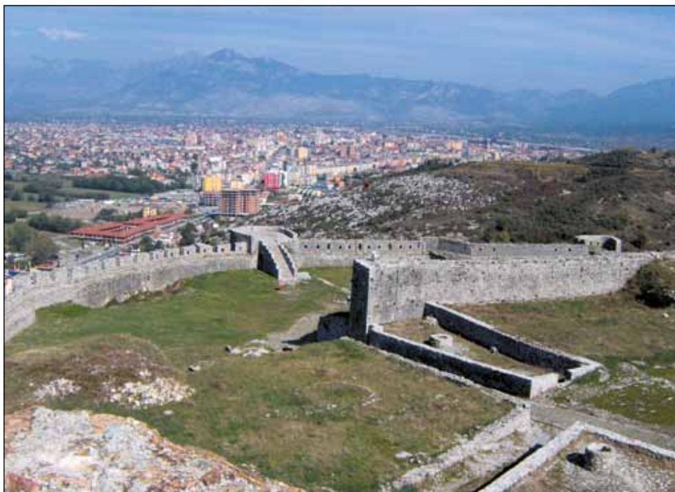
Панорама града Скадра, стари назив Розафа - поглед са Скадарске тврђаве -