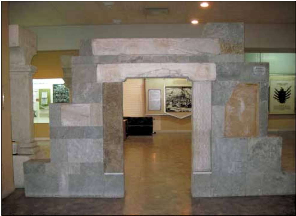
Портал наоса и припрате из цркве Св. Јована Владимира, 14. век, Елбасан три натписа: грчки - надвратник, латински - лева страна, српско-словенски - десна страна Портал се налази у сталној поставци Националног музеја у Тирани