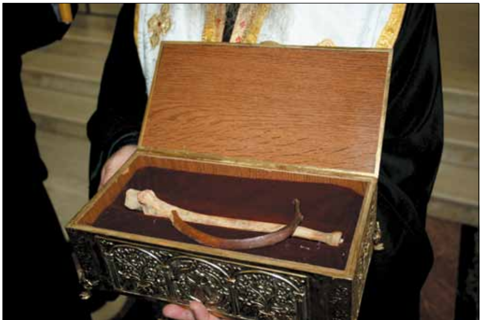
Мошти Св. Јована Владимира и Св. Козме - налазе се у цркви Христовог Васкрсења у Тирани, Албанска православна црква -