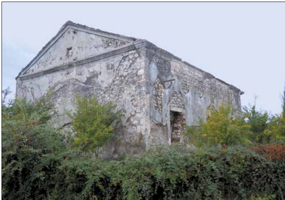
Црква Пресвете Богородице, млади Борич, Врака - подигнута 1869. године -