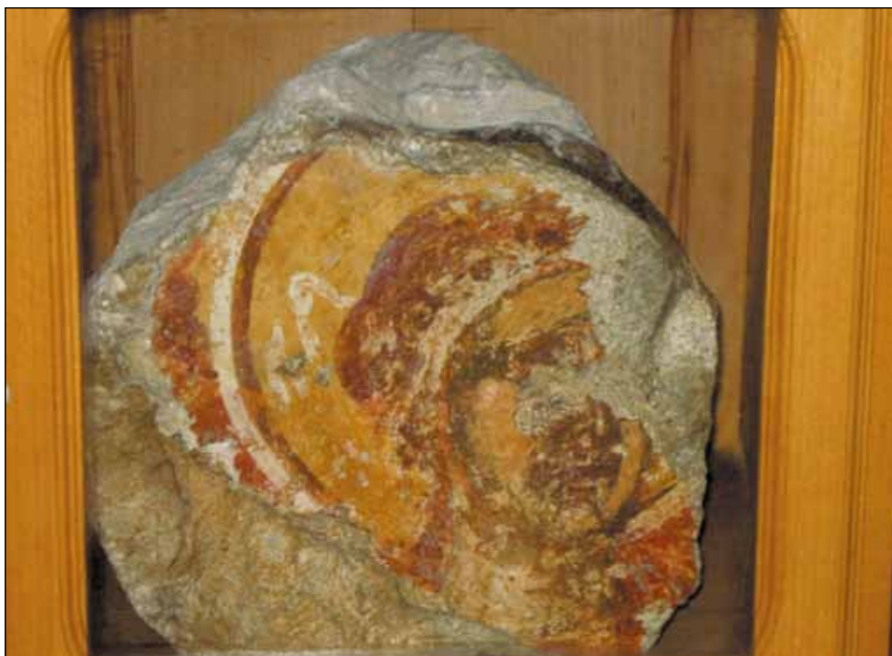
Фрагмент фреске Св. Архангела из цркве Пресвете Богородице, 13. век - чува се као реликвија у цркви Св. Марије, Вау Дејсе -