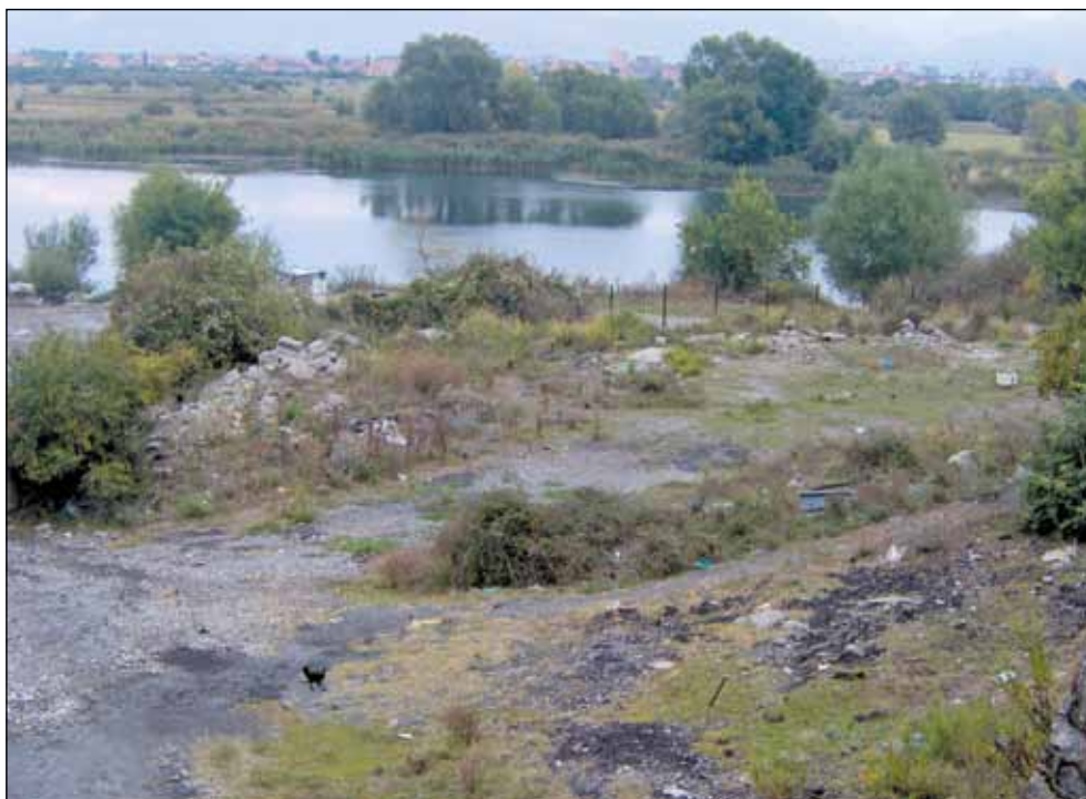
Простор поред реке Бојане у Скадру на коме се налазила црква Св. Николе, подигнута у 14. веку, срушена до темеља у време „културне револуције” шездесетих година 20. века