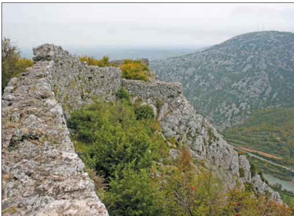
Зидине средњовековног града Дриваста, 9.-10. век