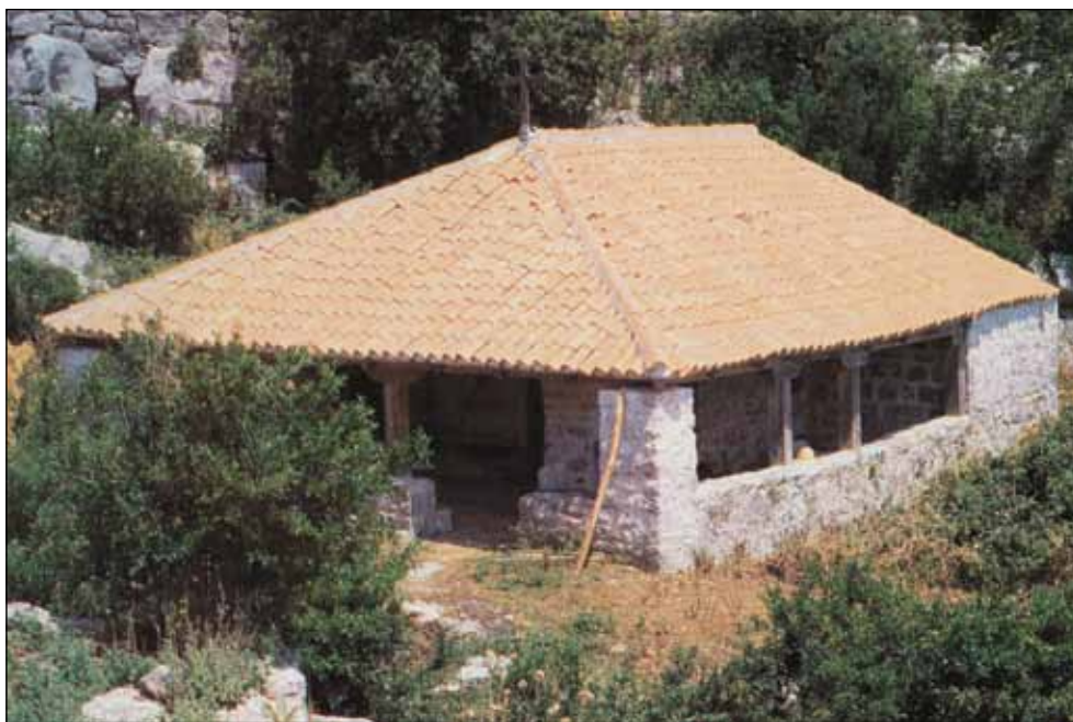
Манастир Ком, црква Пресвете Богородице, 15. век - Зетска Света Гора -