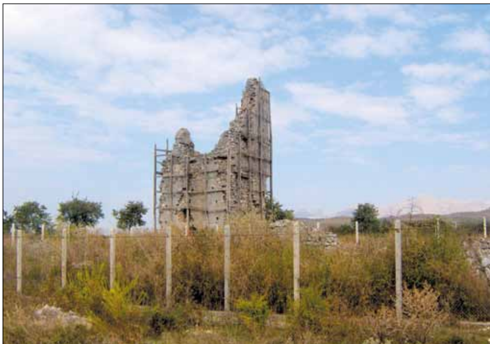
Црква Св. Јована Крститеља, 10. век, налази се у селу Раш-Куле, испод Мараноја, северно од Скадра, домирина звоник - првобитне висине око 50 метара