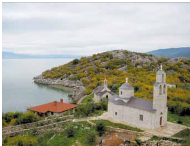
Манастир Бешка, црква Св. Ђорђа, 14. век црква Благовести, 15. век - Зетска Света Гора -