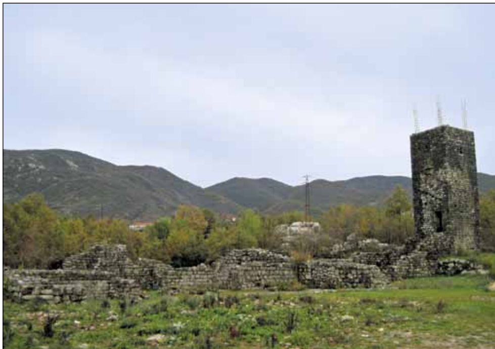
Црква Успења Пресвете Богородице, подигнута 980. године, 10. век - Пречиста Крајинска-Зетска Света Гора - У цркви су били сахрањени кнез Јован Владимир и његова супруга кнегиња Косара