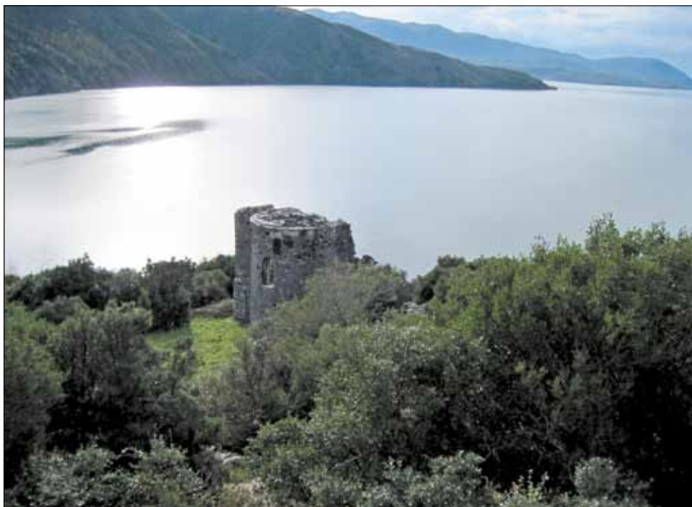
Средњовековни град Сарда - данас острво у Дањском језеру - Вау Дејце У Сарди се налазио велики број цркава „по латинским изворима град са 100 олтара, а по народном предању град са 365 олтара.”