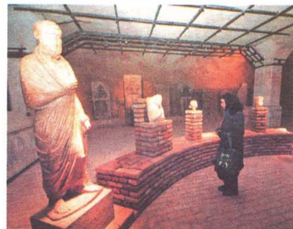
Eksponati iz Narodnog muzeja nisu izlagani više od 30 godina