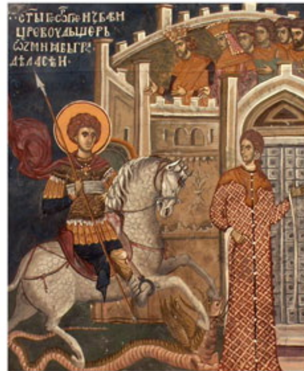
Фреска Победа светог Ћорђа, манастир Дечани.