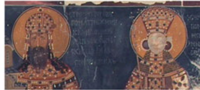
Краљ Милутин и његова жена, принцеза Симонида.

У Богородичиној цркви смо видели ктиторску композицију на којој је насликан краљ Радослав. На овој ктиторској композицији налазе се краљ Милутин, који је дао новац за градњу Студенице, и његова жена, принцеза Симонида. Краљ Милутин у рукама држи модел цркве. Он и принцеза Симонида обучени су у прекрасну раскошну одећу и на главама имају круне. Богородичини родитељи (Јоаким и Ана) воде краља Милутина и принцезу Симониду до Христа. Богородичина мајка држи у рукама малу Богородицу.