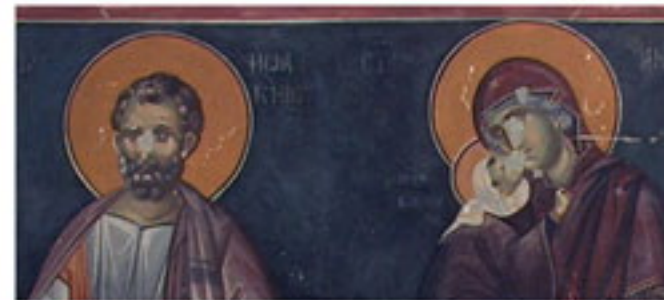
Богородичини родитељи Јоаким и Ана.