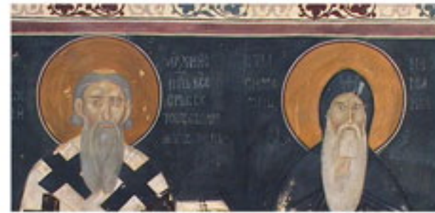
Свети Сава и Стефан Немања.

На овој фресци свети Сава и Немања моле Богородицу да помогне краљу Милутину, да Христу укаже на добра дела која је он чинио. Свети Ћорђе је овде приказан због тога што је он био заштитник династије Немањића. Свети Ћорђе је ратник који се обично слика како убија аждају, која је симбол зла. Слава Ћурђевдан, која пада 6. маја, посвећена је овом светитељу.