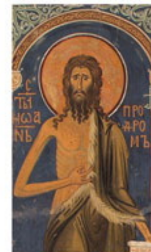
Свети Јован Крститељ