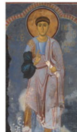
Свети Стефан Првомученик