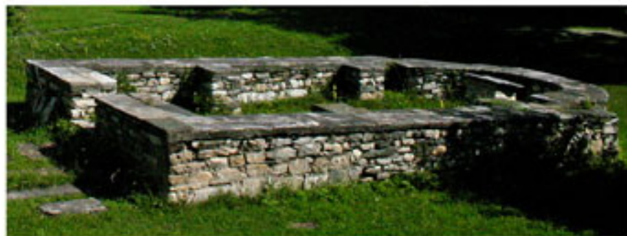
ОСТАЦИ ЦРКВЕ СВЕТОГ ЈОВАНА